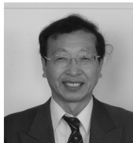
Toshinori Kimura 教授

首先, CIGR 总秘书处向在 2011 年 3 月 11 日日本东北部发生的严重地震和海啸中死亡的人们表示深深的悼念, 向无家可归的人们表示深切的同情。