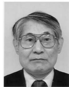
Taichi Maki 教授

基于这种情况，我们在 3 月 29 日组委会时明确表示会根据日程举办 2011 年 9 月 19-23 日在东京的 2011 CIGR 国际研讨会